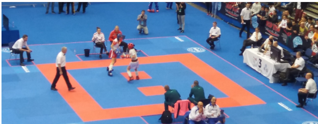
Exemple tatami compétition WAKO kick light